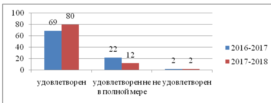
Рис. 1. Мониторинг удовлетворенности образовательным учреждением (за 2 года, в %)

Имеется служба медико-социально-психолого-педагогической поддержки, которая оказывает помощь обучающимся и родителям по вопросам профессиональной адаптации первокурсников, регулярно консультирует обучающихся, родителей, педагогов. Проводится диагностика уровня воспитанности, социализированности личности, развития коллектива, удовлетворенности образовательным учреждением родителями и обучающимися.